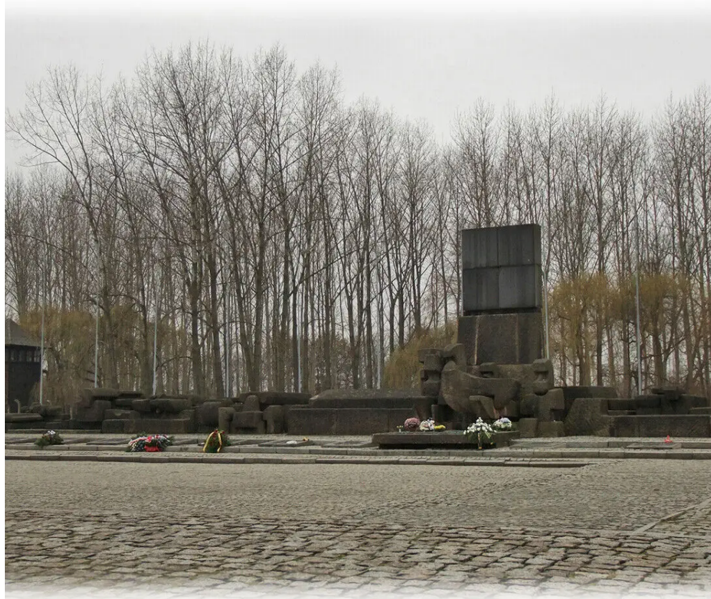
Международный памятник жертвам фашизма расположен в городе Освенцим

«На каждый камень, на каждую дорожку возложат венки, потому что здесь каждая пядь земли полита кровью»