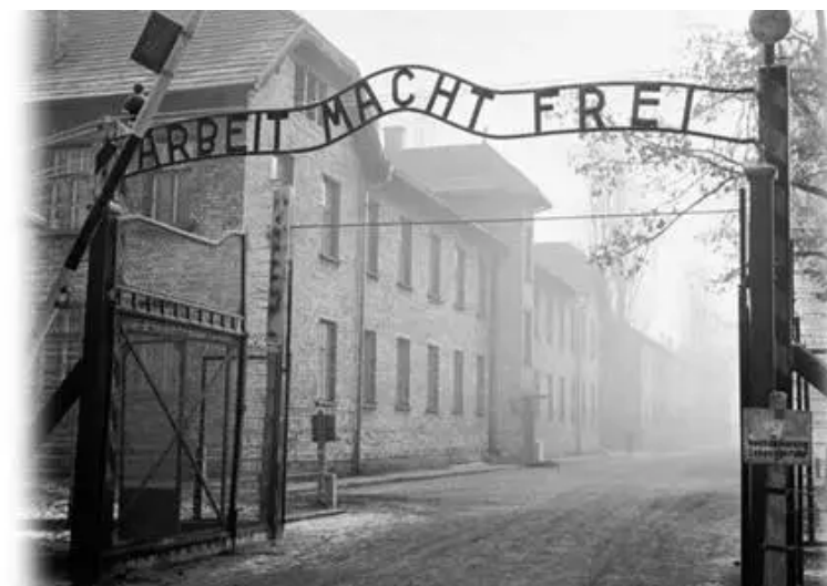
Печально известные ворота нацистского концлагеря Освенцим с циничным лозунгом «Arbeit macht frei», что означает «Труд освобождает»

27 января 1945 года Красная армия вошла в Аушвиц и обнаружила 7600 больных и истощённых заключённых, брошенных за колючую проволоку. Более 4500 человек в первые часы освобождения получили медицинскую помощь. Ещё в середине января при приближении советских войск персонал лагеря приступил к эвакуации комплекса Аушвиц и заставил 60 тыс. заключённых пешком покинуть территорию Польши. Люди погибали по пути не только от изнеможения, но и от рук нацистов. В лагере остались те, кого не успели расстрелять при отходе. В Аушвице за годы его существования (1940–1945) оказались не менее 1,3 млн узников. Точное количество жертв установить невозможно — по подсчётам, погибло около 1,1 млн человек.