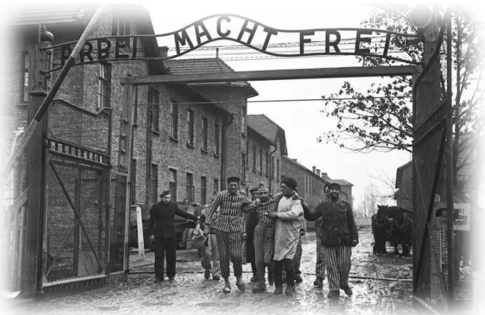
Освобождённых узников концлагеря Аушвиц выводят из лагеря

После войны большинство эсэсовцев и другого персонала, служившего в комплексе Аушвица, так и не предстали перед судом. Из 7000 сотрудников только 63 стали фигурантами процессов. Первый состоялся в Кракове в ноябре и декабря 1947 года. Польские власти осудили 41 эсэсовца. В их числе были Артур Либебеншель (комендант Аушвица I) и Мария Мандель (директор женского лагеря Аушвиц II), которых приговорили к смертной казни. Рудольф Хёсс (комендант и инспектор Аушвица) был также осужден и повешен 16 апреля 1947 года на территории комплекса. Второй судебный процесс проходил во Франкфурте в период с декабря 1963 года по август 1965 года. Судебные процессы основывались на немецком государственном праве, а не на международном, использованном на Нюрнбергском процессе 1945 года, и поэтому каждому из обвиняемых было предъявлено обвинение либо в убийстве, либо в соучастии в убийстве, а не в преступлениях против человечности и геноциде. Двое из двадцати подсудимых были оправданы, двенадцать получили сроки от 3 до 10 лет, шестерых осудили на пожизненное заключение. Йозеф Менгеле скрылся и сбежал в Южную Америку. До самой смерти в 1985 году он жил со страхом быть пойманным.