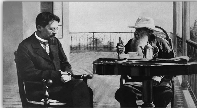
Лев Толстой и Антон Чехов в Гаспре. 1901 год

Лев Николаевич Толстой бывал в Крыму несколько раз и провел на полуострове в общей сложности два года своей жизни. В Севастополе им были созданы прославившие его "Севастопольские рассказы". В 1901 году писатель отдыхал в Крыму во дворце графини Паниной "Гаспра". Помимо дневников, Толстой работал в Гаспре над повестью "Хаджи-Мурат".